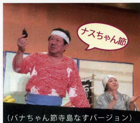
(バナちゃん節寺島なすバージョン)